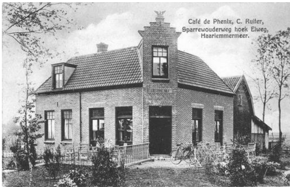
Schipholweg N 082, Boesingheliede – 1921 Café de Phenix. Nu autobedrijf van Vught