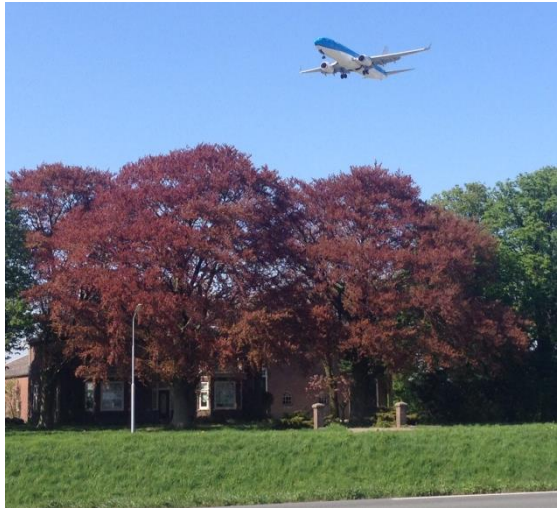
MOOIE BOMEN AAN DE HOOFDWEG